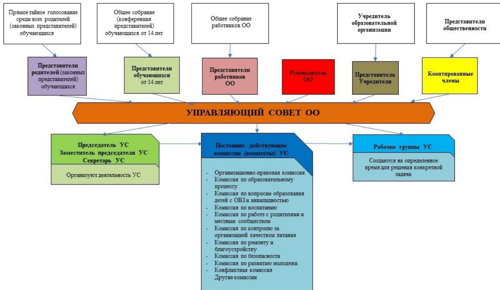
Рис. 1. Модель № 1 – «Управляющий совет общеобразовательной организации» (УС ОО)